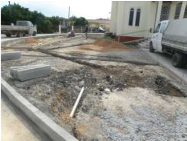
Διαμόρφωση περιβάλλοντος χώρου Κομμένου

Ολοκληρώθηκαν οι εργασίες για την «Αναπαλαίωση κτιρίου στο Κομμένο και διαμόρφωση περιβάλλοντος χώρου» με προϋπολογισμό 160.000,00 ευρώ.