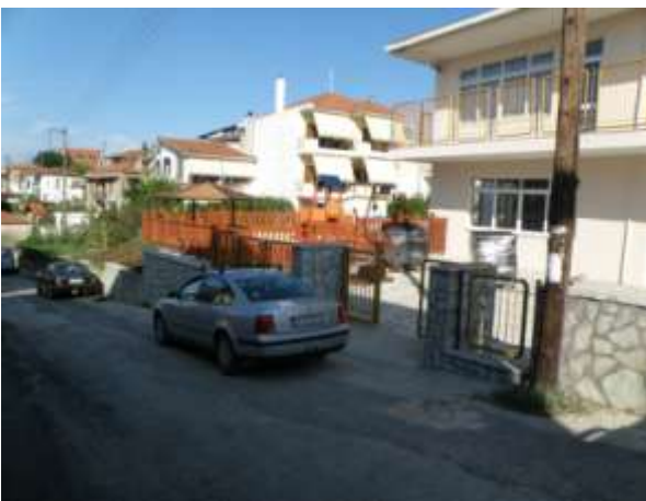
Παιδικός Σταθμός Πέτα

Εντάξαμε στο ΕΣΠΑ και κατασκευάσαμε ένα σύγχρονο Παιδικό σταθμό στο Πέτα προϋπολογισμού 325.000 ευρώ και τα παιδάκια χαίρονται έναν σύγχρονο και ασφαλή Σταθμό .