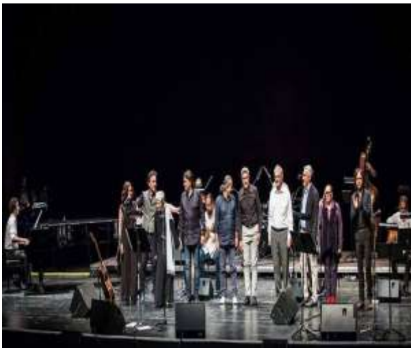
Μουσικό έργο Έλληνες φιλέλληνες στο Μέγαρο Μουσικής Αθηνών