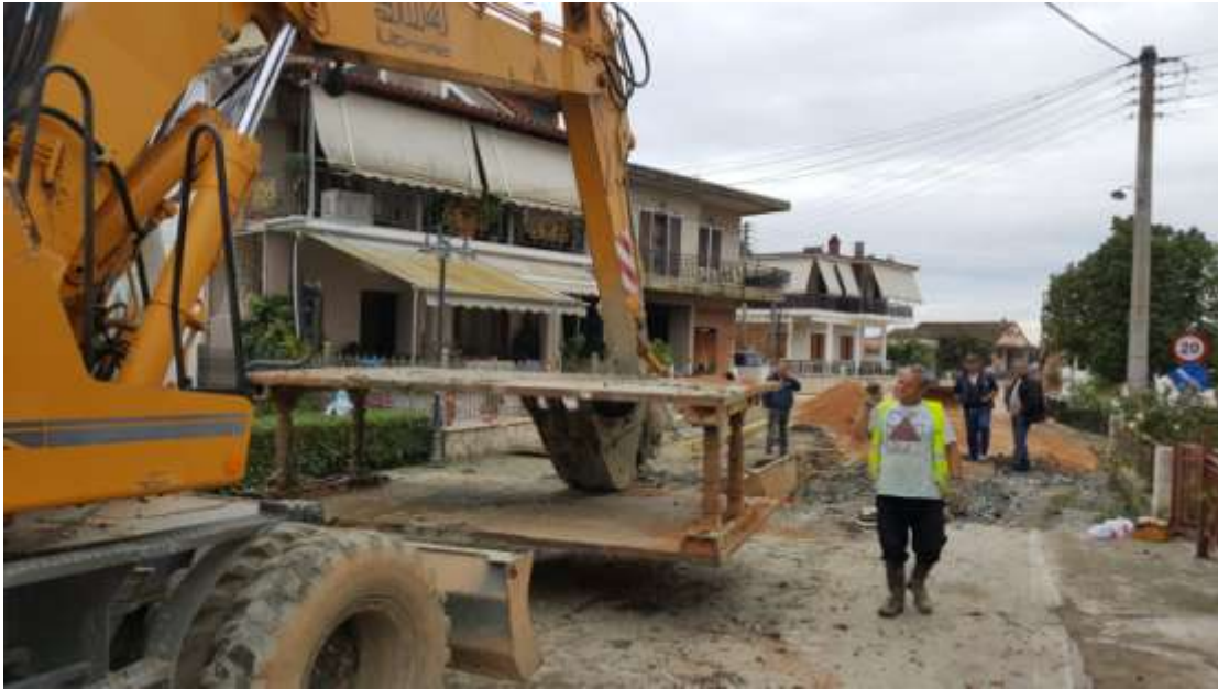
Κατασκευή δικτύου ακαθάρτων Αγίας Παρασκευής

Ο Βιολογικός Καθαρισμός και η Αποχέτευση για τη Δημοτική Ενότητα Αράχθου (Νεοχώρι - Παχικάλαμος - Ακροποταμιά) προϋπολογισμού 14.692.296,00 ευρώ, δημοπρατήθηκε υπογράφηκε η σύμβαση και άρχισαν οι εργασίες.