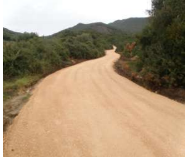
Βελτίωση αγροτικών δρόμων