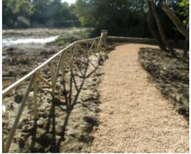
Διαμόρφωση χώρου υπαίθριας αναψυχής στην παραποτάμια περιοχή της Δ.Κ. Κομποτίου