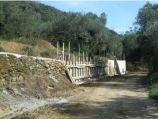
Αγροτική οδοποιία Πέτα