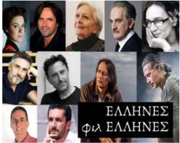
Μουσικό έργο Έλληνες φιλέλληνες