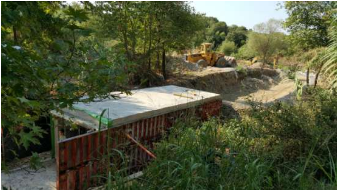
Εγκιβωτισμός ρέματος Κατσαρέλου