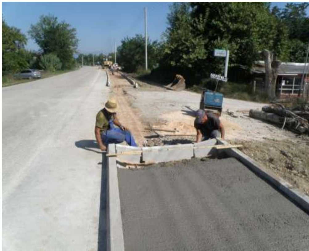
Ανάδειξη παραποτάμιας περιοχής από το Δ.Δ. Νεοχωρίου ως το Δ.Δ. Ακροποταμιάς