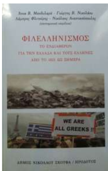
Βιβλίο «Φιλελληνισμός – Το ενδιαφέρον για την Ελλάδα και τους Έλληνες από το 1821 ως σήμερα.