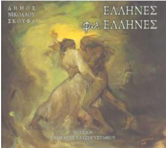
Μουσικό Έργο Έλληνες φιλέλληνες