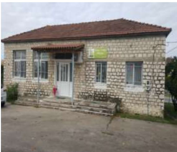
Παιδικός Σταθμός Ανθότοπου

Δημιουργήσαμε Παιδικό Σταθμό στον Ανθότοπο και η λειτουργία του συνεχίζεται με επιτυχία.