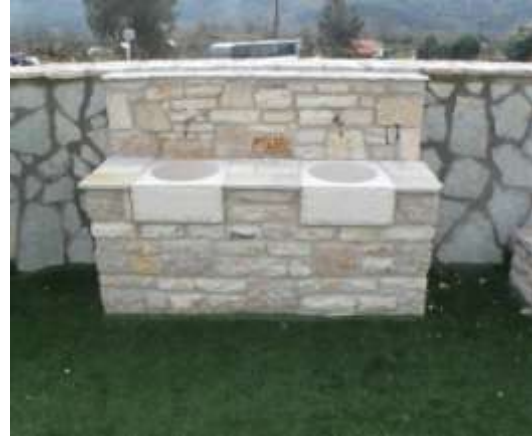
Παιδική χαρά Αμφιθέας

Κινηθήκαμε μεθοδικά και συγκροτημένα για την προώθηση τόσο της απορρόφησης, όσο και της προετοιμασίας ώριμων προτάσεων, δημιουργώντας τις προϋποθέσεις για ένταξη.