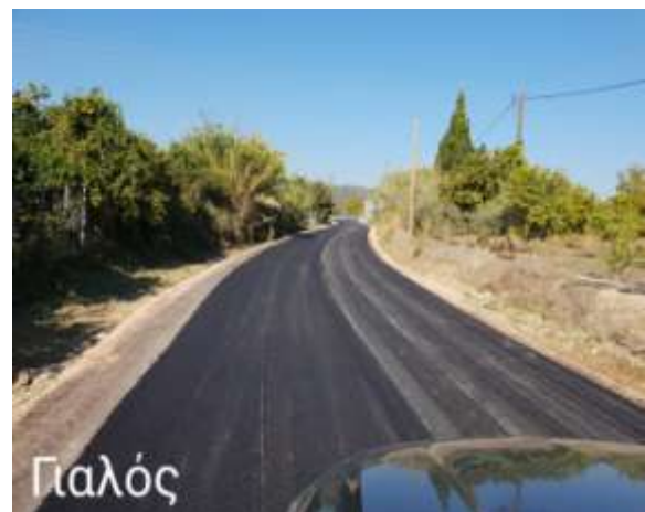
Βελτίωση αγροτικών δρόμων