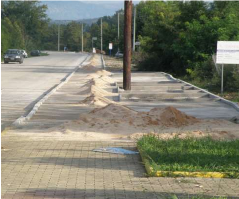
Ανάδειξη παραποτάμιας περιοχής από το Δ.Δ. Νεοχωρίου ως το Δ.Δ. Ακροποταμιάς