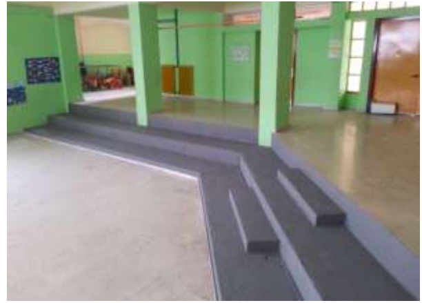
Δημοτικό Σχολείο Αγίου Δημητρίου