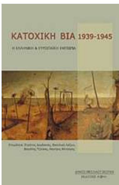
Βιβλίο «Κατοχική Βία 1939-1945»