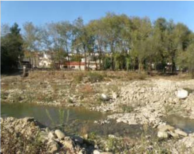
Διαμόρφωση χώρου υπαίθριας αναψυχής στην παραποτάμια περιοχή της Δ.Κ. Κομποτίου