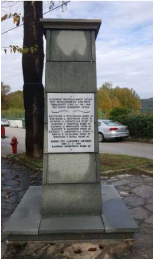
Μνημείο Στον Παχγκάλαμο