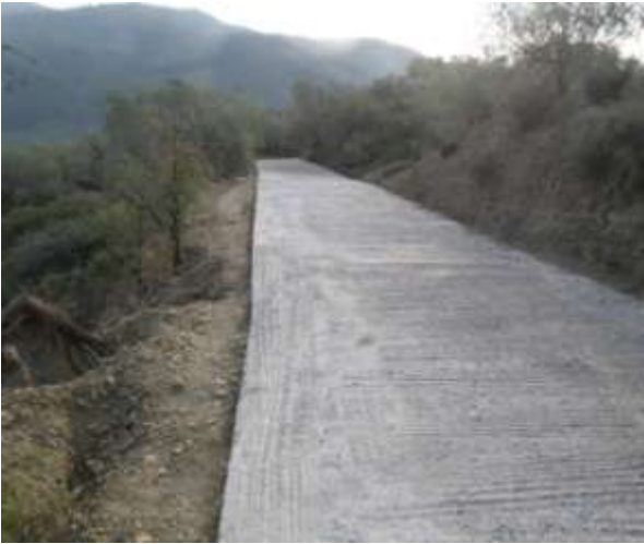
Βελτίωση αγροτικών δρόμων