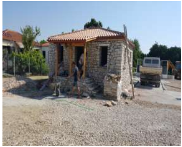
Αναπαλαίωση κτιρίου στο Κομμένο

Από την Βουλή των ελλήνων εγκρίθηκε ποσό 10.000 ευρώ για την προμήθεια ψηφιακών stad και έχει υποβληθεί τεχνικό δελτίο για την χρηματοδότηση από το ΠΔΕ του Υπουργείου Εσωτερικών 130.000 ευρώ για την ολοκλήρωση του έργου.