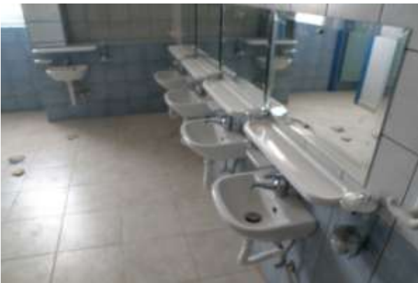
Παιδικός Σταθμός Πέτα