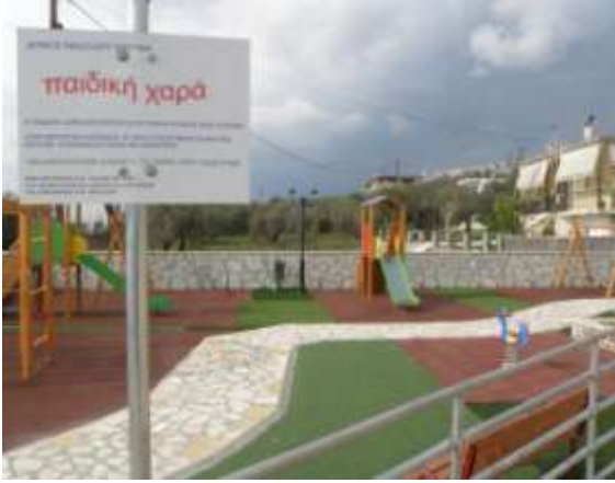
Παιδική χαρά Αμφιθέας

στην εξυπηρέτηση όλων των Δημοτών στον τόπο κατοικίας των και στη δημιουργία συνθηκών ανάπτυξης.