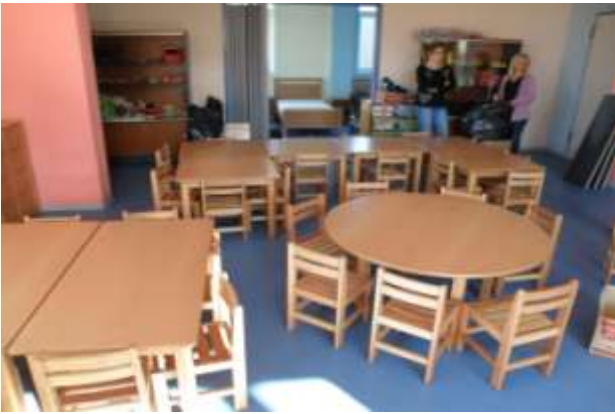
Παιδικός Σταθμός Πέτα