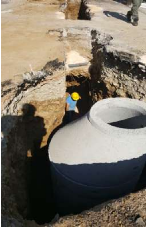
Κατασκευή δικτύου ακαθάρτων