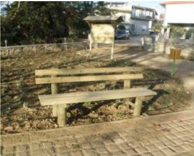
Διαμόρφωση χώρου υπαίθριας αναψυχής στην παραποτάμια περιοχή της Δ.Κ. Κομποτίου