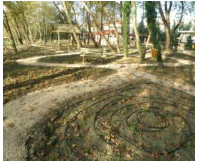
Διαμόρφωση χώρου υπαίθριας αναψυχής στην παραποτάμια περιοχή της Δ.Κ. Κομποτίου