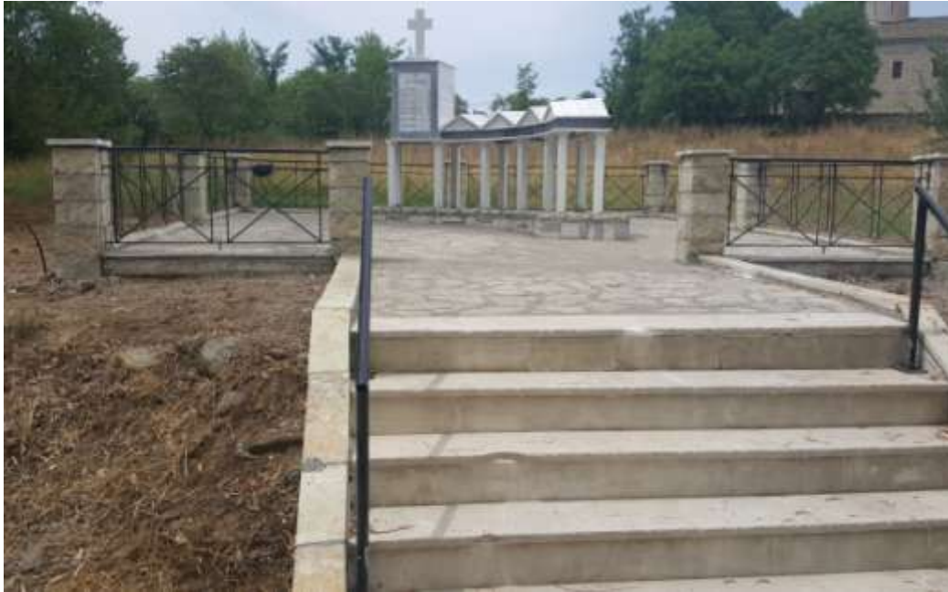
Μνημείο στις Σελλάδες