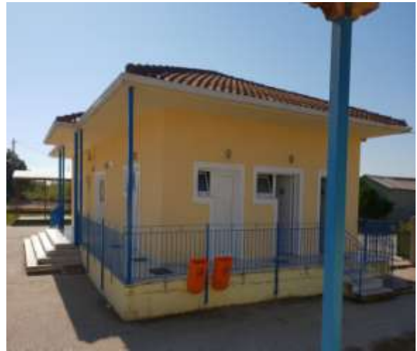
Δημοτικό Αγίας Παρασκευής