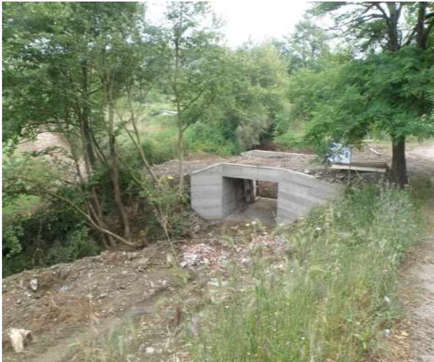
Αποκατάσταση διατομών τάφρων και κατασκευή οχετών Δ.Ε. Κομποτίου