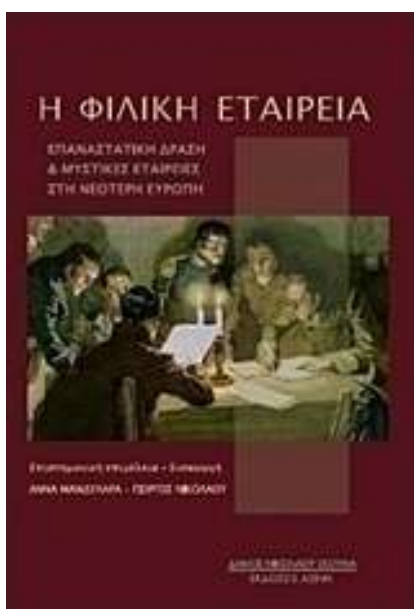
Βιβλίο «Η Φιλική Εταιρεία»

Ενώ η άριστη συνεργασία με το Πανεπιστήμιο Ιωαννίνων είχε ως αποτέλεσμα την υπογραφή νέου μνημονίου συνεργασίας με στόχο την ανάδειξη της Ιστορίας μας. Αυτή δε η συνεργασία, μας έδωσε την δυνατότητα να οργανώσουμε σπουδαίες εκδηλώσεις που έγιναν γνωστές ανά την Ελλάδα και να εκδοθούν σπουδαία συγγράμματα.