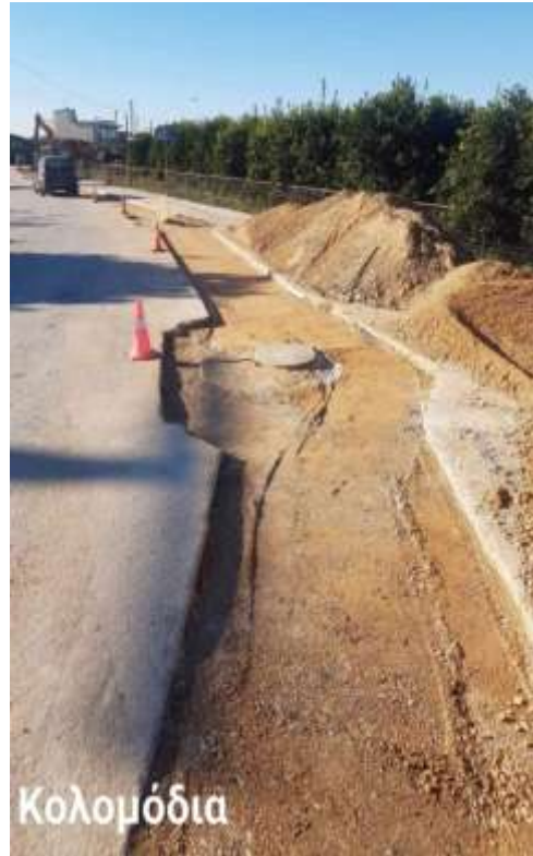
Κατασκευή δικτύου ακαθάρτων

Ολοκληρώνονται τα δίκτυα ακαθάρτων για τους οικισμούς Κολομόδια –Ανθότοπος που εντάχτηκαν στο πρόγραμμα ΕΣΠΑ 2014-2020, με Προϋπολογισμό 3.571.574€ . Οι εργασίες προχωράνε με γοργούς ρυθμούς και η μικρή ταλαιπωρία των δημοτών παίρνει τέλος.