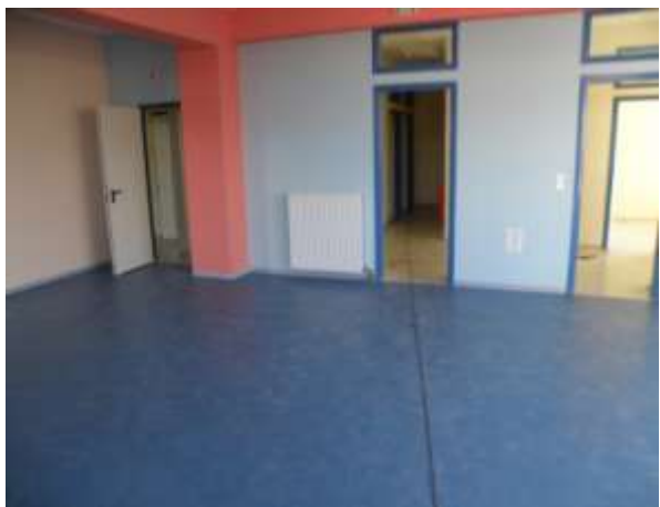
Παιδικός Σταθμός Πέτα