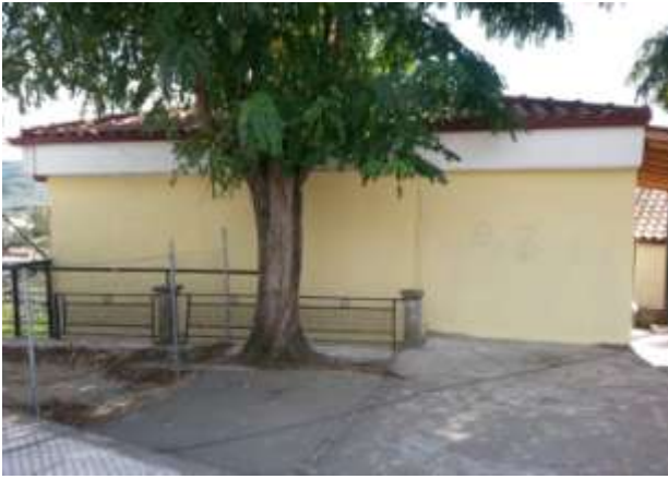
Δημοτικό Σχολείο Κομποτίου