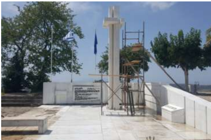
Μνημείο στο Πέτα

κατεστραμμένων, στο Κομπότι έγινε συντήρηση του ανδριάντα του Νικολάου Σκουφά στην κεντρική πλατεία καθώς και του ανδριάντα του Γεωργίου Καραϊσκάκη ενώ στο Πέτα, στο κεντρικό μνημείο του οικισμού, κατασκευάστηκε πέτρινος παραδοσιακός τοίχος στο μονοπάτι που οδηγεί προς το μνημείο και τοποθετήθηκαν καινούρια μάρμαρα σε σημεία που είχαν καταστραφεί. Ανάλογες εργασίες και τέτοιου είδους παρεμβάσεις πραγματοποιήθηκαν και στα κεντρικά μνημεία των Τ.Κ. Φωτεινού, Περάνθης και Συκεών. Πραγματοποιήθηκε λοιπόν μια πολύ καλή και συντονισμένη προσπάθεια συντήρησης και διατήρησης των πολιτιστικών μνημείων μας, τα οποία αναμφισβήτητα αποτελούν και αντικατοπτρίζουν την μεγάλη ιστορία του Δήμου μας.