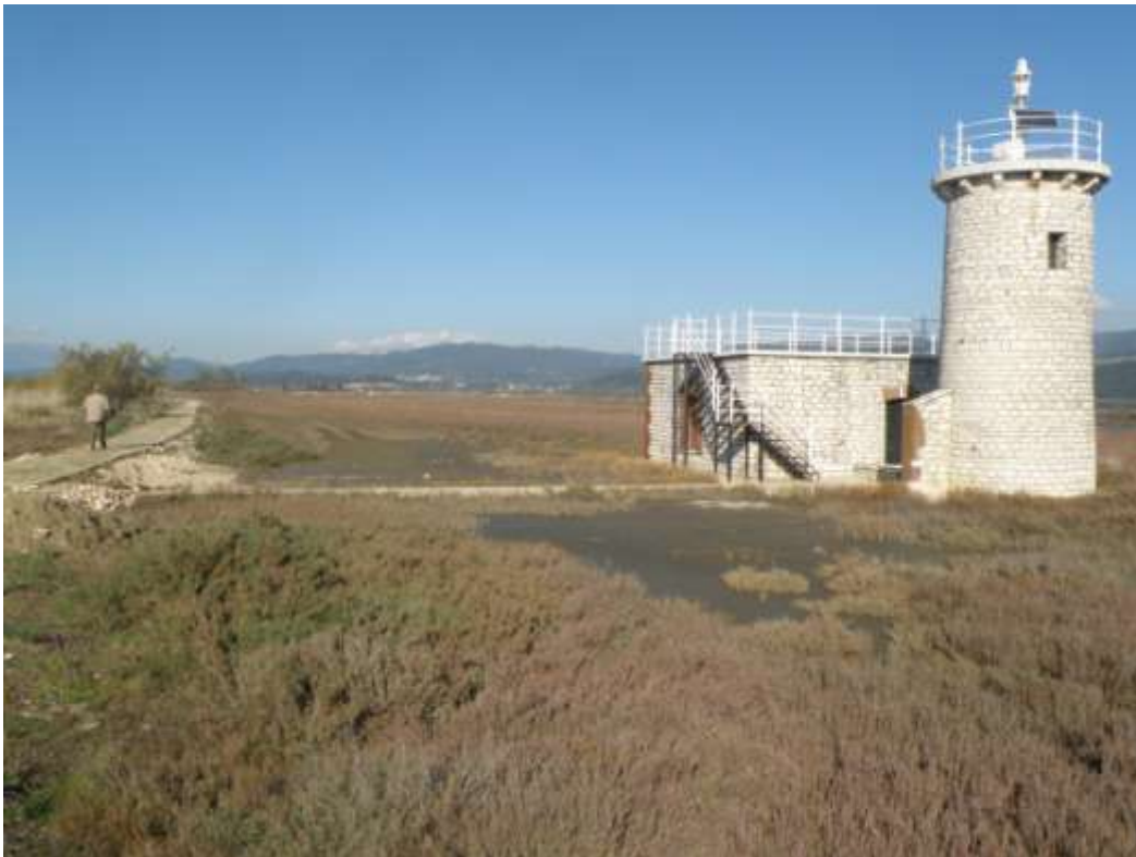
Φάρος στην Κόπραινα