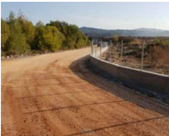
Βελτίωση αγροτικών δρόμων