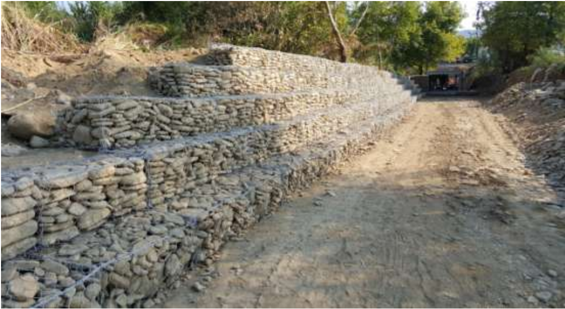
Εγκιβωτισμός ρέματος Κατσαρέλου

Εντάχθηκε ο εγκιβωτισμός του ρέματος Κατσαρέλου προϋπολογισμού 1.785.000,00 € με ΦΠΑ. Ολοκληρώθηκαν οι εργασίες και αναμένεται η ολοκλήρωση της μελέτης για ανάπλαση της περιοχής.