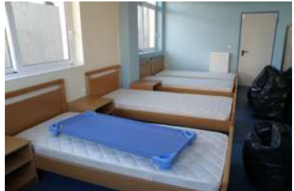
Παιδικός Σταθμός Πέτα