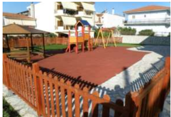
Παιδικός Σταθμός Πέτα

Δημιουργήσαμε Παιδικό Σταθμό στον Ανθότοπο και η λειτουργία του συνεχίζεται με επιτυχία.