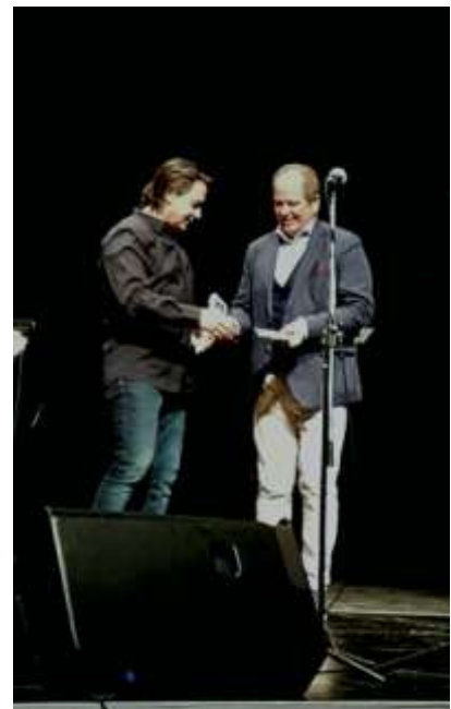
Μουσικό έργο Έλληνες φιλέλληνες στο Μέγαρο Μουσικής Αθηνών

Ο Δήμος μας στα χρόνια που διανύσαμε δεν «κρύφτηκε» με παρεμβάσεις και δελτία τύπου.