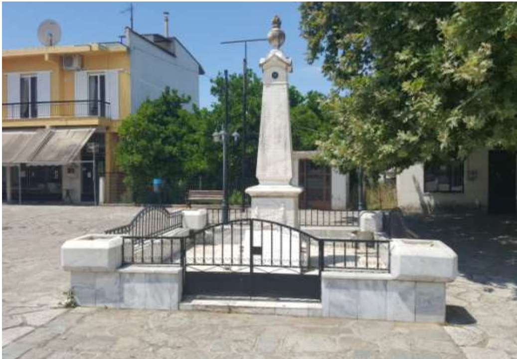
Μνημείο στο Κομμένο