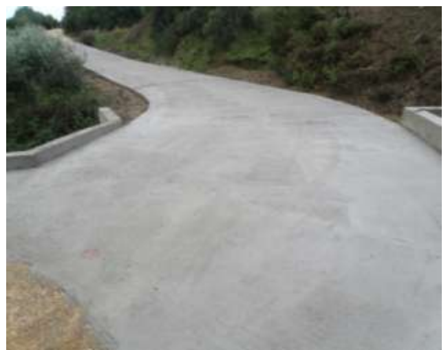
Αγροτική οδοποιία Κομποτίου