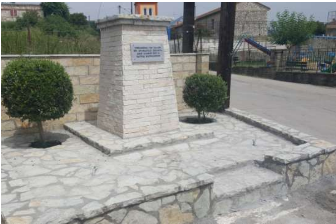
Μνημείο στις Σελλάδες