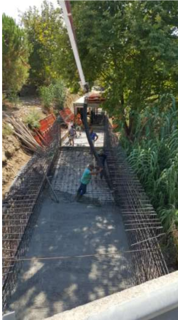
Εγκιβωτισμός ρέματος Κατσαρέλου

Από τις Έξι ολοκληρωμένες προτάσεις που υποβάλαμε στο διασυνοριακό πρόγραμμα Ελλάδα – Αλβανία που αφορούν την ενίσχυση της τοπικής παραγωγής με δράσεις που περιγράφονται στις προτάσεις και στοχεύουν να δώσουν προστιθέμενη αξία στα τελικά προϊόντα, εγκρίθηκαν δύο. Της επιτραπέζιας ελιάς(Olive Culture) (με έμφαση στην