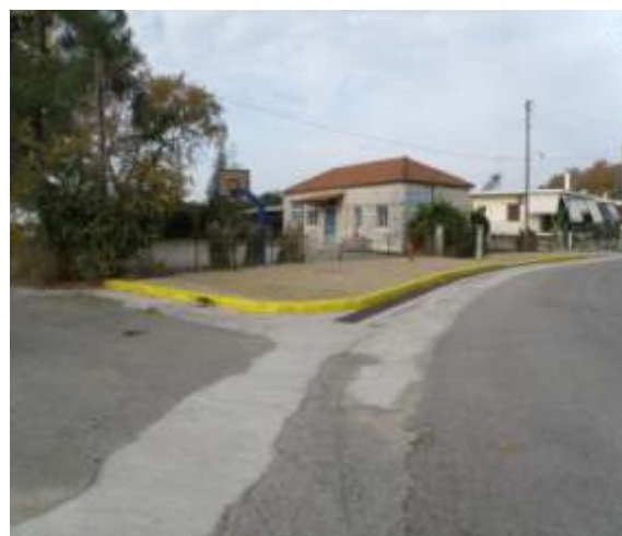
Παιδικός Σταθμός Ανθότοπου