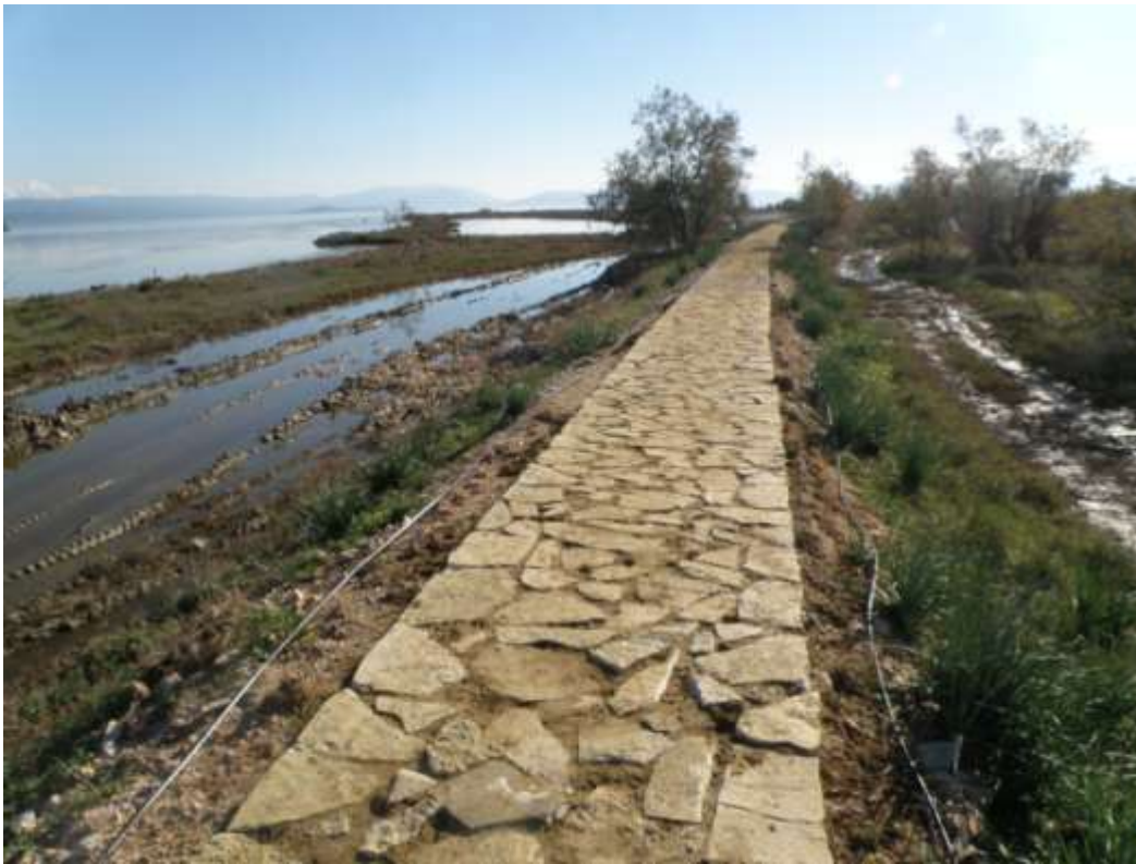
Βελτίωση, σήμανση και φύτευση του μονοπατιού από τα κτίρια της Κόπραιναις προς το Φάρο